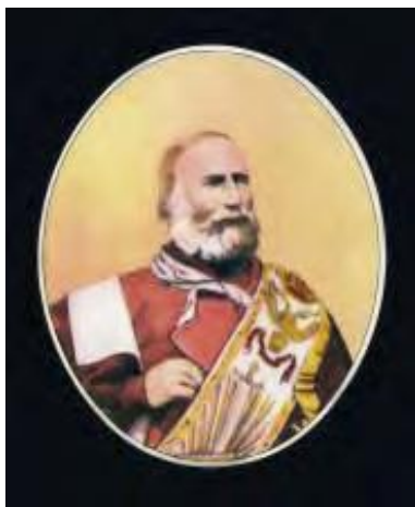
Giuseppe Garibaldi, 33° S.P.S.R.

Skutečné rozčlenění 33 stupňů do 3 sérií po jedenácti se nachází pouze v nejtajnějších instrukcích , mimo 33. stupně, a v symbolech , pod nimiž se skutečná zednářská tajemství „nepřístupně skrývají“ . 278 Jedním z těchto dokumentů je tajná instrukce , udělená generálu Giuseppe Garibaldi mu k jeho povýšení na hlavu zednářstva . Tento dokument, jedno z nejjasnějších světel , jaké se kdy z příšeří zednářstva vynořilo , s plnou autoritou neznámé vrchnosti zednářstva jasně a jednoznačně potvrzuje skutečný význam rozčlenění 33 stupňů Starého a Přijatého Skotského Rituálu do tří sérií po 11 stupních. 279